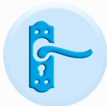
РУЧКИ ДВЕРЕЙ И ШКАФОВ

ТО, К ЧЕМУ МЫ ПРИКАСАЕМСЯ ЧАЩЕ ВСЕГО ДОЛЖНО БЫТЬ ЧИСТЫМ