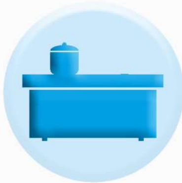
ПОВЕРХНОСТИ СТОЛЕШНИЦ, ПОЛОК