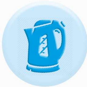
КНОПКИ БЫТОВЫХ ПРИБОРОВ