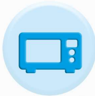
ПАНЕЛИ БЫТОВОЙ ТЕХНИКИ