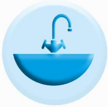
РАКОВИНЫ И СМЕСИТЕЛИ